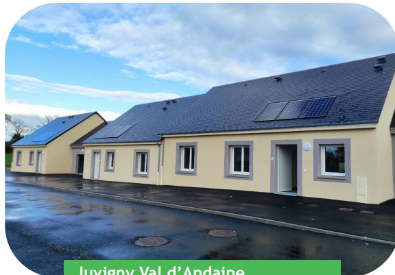
Juvigny Val d'Andaine