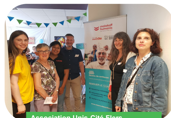
Association Unis-Cité Flers